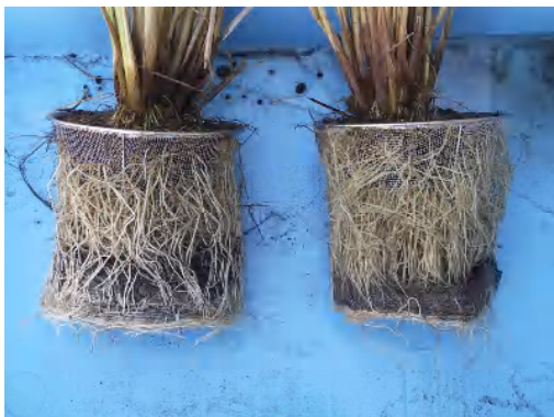
左：根の太い「タチアオバ」 右：「ミナミヒカリ」

地上部全重収量に優れた稲発酵粗飼料用品種として「ニシアオバ (平成 16 年度)」と「タチアオバ (平成 18 年度)」を育成した。特に、「タチアオバ」はアメリカ品種から優れた根張り性を導入し、高い草丈にもかかわらず優れた耐倒伏性を備えた稲発酵粗飼料用品種である。