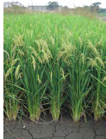
長稈で耐倒伏性の高い 「タチアオバ」