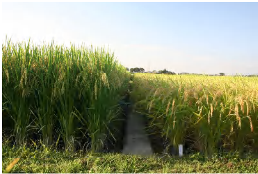
左：長稈の「たちすがた」 右：主食用水稻「コシヒカリ」

稲発酵粗飼料と飼料米の兼用品種として、TDN 収量と玄米収量の両方が優れた「ホシアオバ (平成 13 年度)」、「クサホナミ (平成 13 年度)」、「クサノホシ (平成 13 年度)」を育成した。また、稲発酵粗飼料で問題とされる未消化粗の発生を解決するために、茎葉の割合が高く (玄米収量が低く全重収量が高い)、消化性に優れた稲発酵粗飼料用品種として「リーフスター (平成 17 年度)」、「たちすがた (平成 20 年度)」を育成した。また、飼料米の利用に重点を置いた玄米収量に優れた品種として「モミロマン (平成 20 年度)」を育成した。