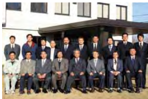
成分調整堆肥研究グループのみなさん

「家畜排せつ物法」の施行後、堆肥の生産量は急速に増大しているが、堆肥の生産量に対し利用が追いつかず、堆肥の利用拡大が急務となっている。耕種農家が家畜ふん堆肥を利用しない主な理由は、①散布に労力がかかる（散布してもらえば使う）、②化学肥料と異なり肥料の効き方がわからない等である。堆肥の利用を大幅に拡大するためには、今まで堆肥を使ってこなかった耕種農家でも容易に使用できるように、使いやすく流通にも適する堆肥の加工技術の開発が重要になっている。このため、九州沖縄農業研究センターをはじめ、畜産草地研究所、熊本、福岡、鹿児島各公立試験場、ならびに、熊本県の普及センターやJAが共同して成分調整成型堆肥の生産・利用技術の開発を行った。