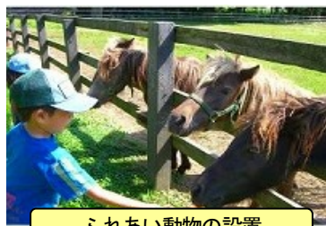
ふれあい動物の設置

また本牧場内には、現存する最古のきゅう舎とされている南部曲がり家や神社など歴史的に価値のある建造物が8カ所あり、登録文化財に指定されている。これら文化財を自費で管理しているほか、毎年近隣住民を招いて神社の例大祭を実施するなど信心深く、多くの自費を投じて地域農業や地域社会との協調・融和に積極的に取り組んでいる。