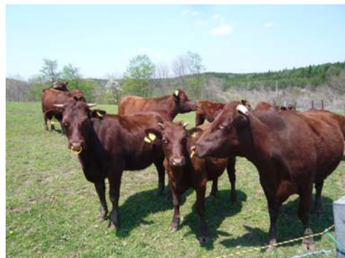
粗飼料の利用性が高い日本短角種を飼養する