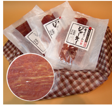
オリジナル商品のビーフジャーキー