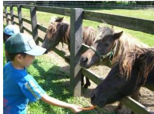
ふれあい牧場「ハッピーファーム」には地元の子どもたちが遊びにくる