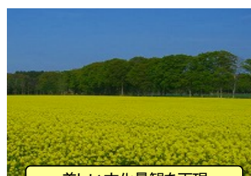
美しい文化景観を再現