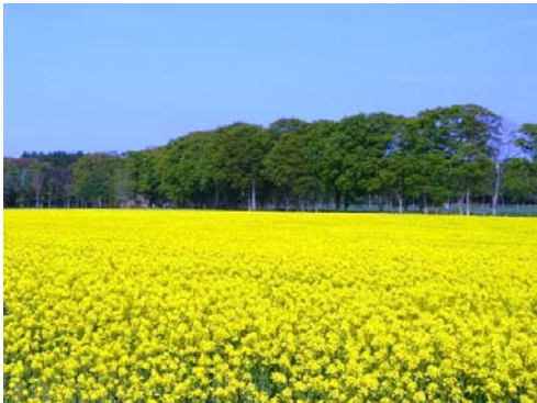
たい肥を利用した無農薬の菜の花栽培