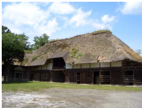
地域との融和を大切にし、地域文化財の保存に取り組む