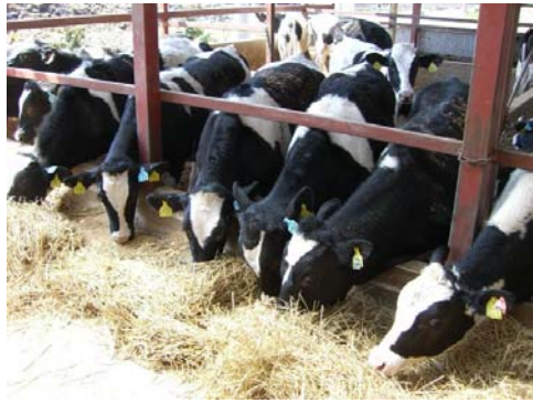
安全・安心にこだわったオリジナルブランド「健・育・牛」