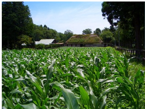
エサにも安全性を求め、自給飼料生産にも取り組む