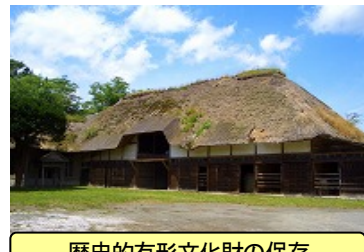
歴史的有形文化財の保存