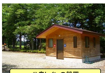
公衆トイレの設置