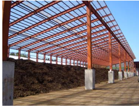
良質たい肥は地元の耕種農家から注文が多い