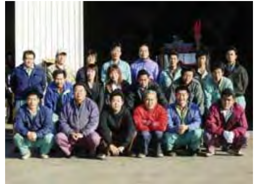
JA 鹿追町コントラクター課の方々

鹿追町は北海道の一大農業地帯十勝平野の北西部に位置し、大雪山国立公園の一部を含む夫婦山のふもとに広がる山麓農村地帯で、農業（酪農・畑作）を基幹産業としている。